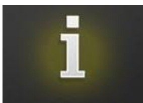
TABLEAU DES GAINS