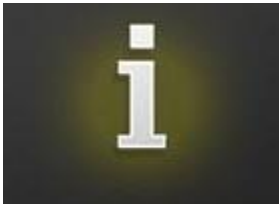
TABLEAU DES GAINS