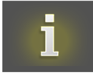
TABLEAU DES GAINS

Vue des règles du jeu et des prix à gagner pour les combinaisons de symboles gagnantes.