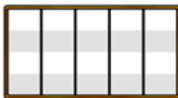
ENSEMBLE DE CYLINDRES PRINCIPAL 5 X 4